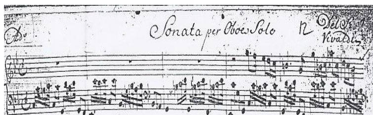
2. A. VIVALDI, “Sonata in do minore” RV53, I movimento, battute 1-5.

Nella sonata in Do minore, i passaggi dall’Adagio iniziale al secondo tempo sottoforma di Allegro e dal terzo tempo Andante all’ultimo Allegro richiedono all’esecutore un grande controllo di emissione e una grande duttilità tecnica.